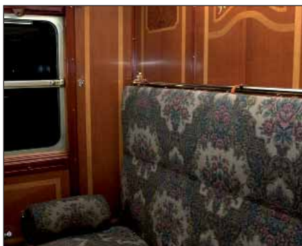
Departamento del ZZ-1101.

El ferrocarril del pasado en su proyección de futuro”, así se presenta el Centro de Estudios Históricos del Ferrocarril Español, CEHFE, una entidad creada en 1997 y que culminó un proceso de fusión entre varias entidades que apoyaban el ferrocarril en todos sus ámbitos desde hacía dos décadas. El estudio de la evolución del material móvil,