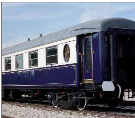
Perspectiva del coche salón ZZ-1101.

Propietario: Centro de Estudios Históricos del Ferrocarril Español. www.cehfe.es - www.cgft.net