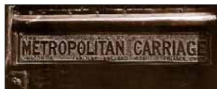
Placa del coche.