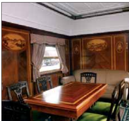
Salón interior del coche.

el rescate y su restauración, son algunas de sus principales acciones. Posteriormente, y bajo las directrices del CEHFE, se creó la Compañía General de Ferrocarriles Turísticos, CGFT, con el objetivo de poner en marcha trenes históricos de ancho ibérico.