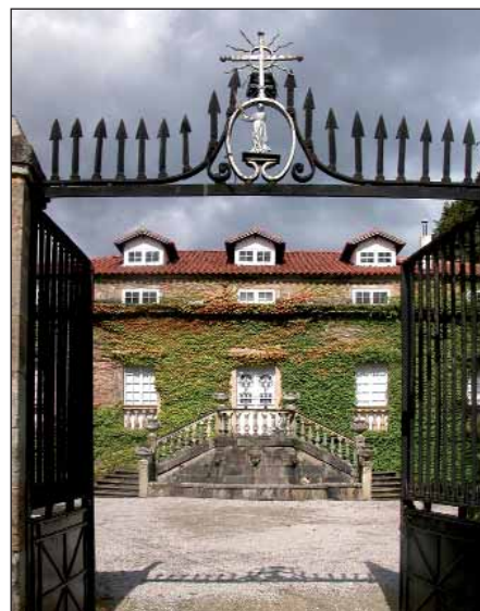
Fachada del Palacio de Ontaneda, sede del CEHFE.

No obstante, se está rehabilitando una nave en la barcelonesa localidad de Martorell donde se agrupará todo el material gestionado por CEHFE, para ser expuesto y, por tanto, ser visitado. Se prevé la inauguración para la primavera de 2008. A.G.S. □